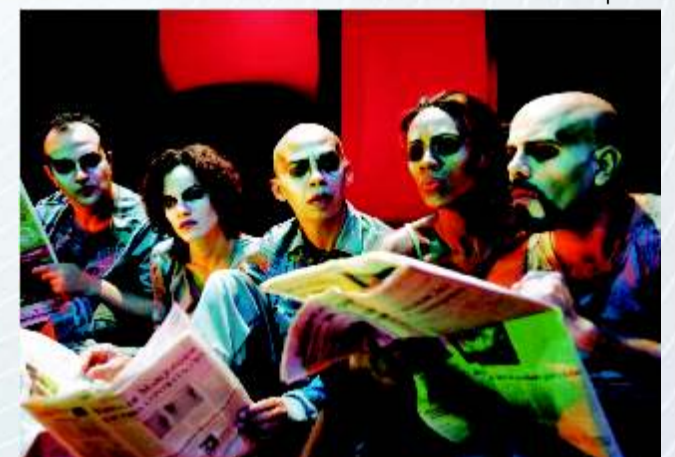
Angu de Sangue, com a atriz global Hermila Guedes, também participa do FTB