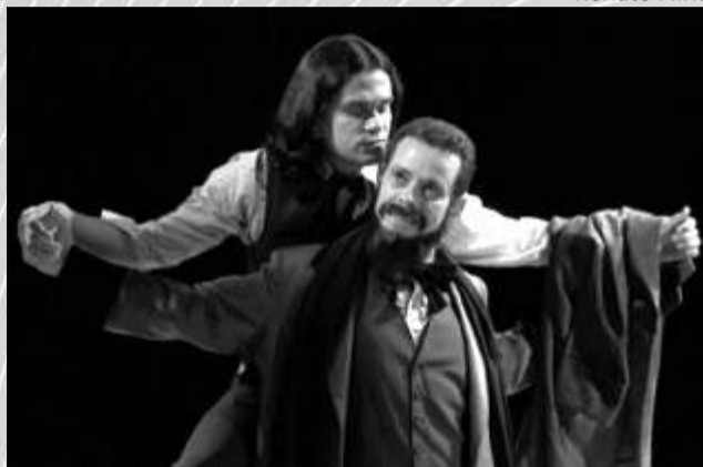
Anjos de Fogo e Gelo

A terceira edição do Festival Palco Giratório Brasil-Recife - um dos maiores eventos das artes cênicas do país - irá apresentar 37 espetáculos, de 37 companhias vindas de nove estados brasileiros, durante todo o mês de maio, em 10 pólos espalhados pelo Recife. Castanha sua Cor , do Grupo Grial (PE) abre a programação, dia 2, às 20h, no Teatro de Santa Isabel.