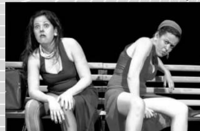
De Malas Prontas