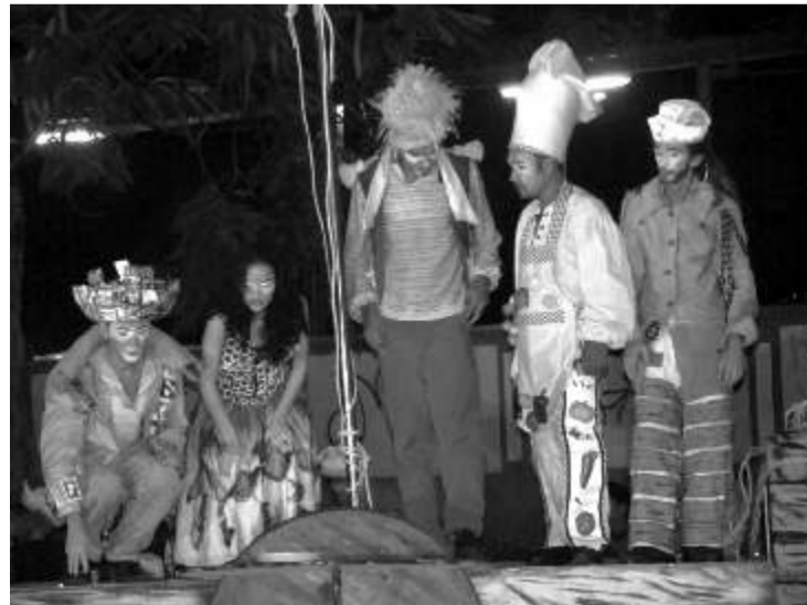
Cena do novo espetáculo do Grupo da Gente, do Cabo, Viva a Nau Catarineta , que participa do Palco Giratório