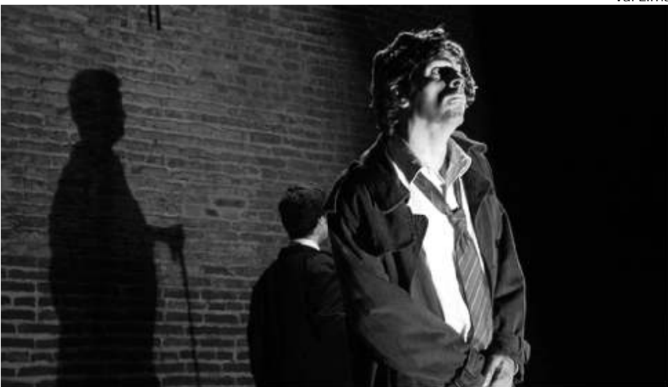
Espetáculos experimentais marcam o Playdog – projeto Aprendiz Encena, no Apolo/Hermilo