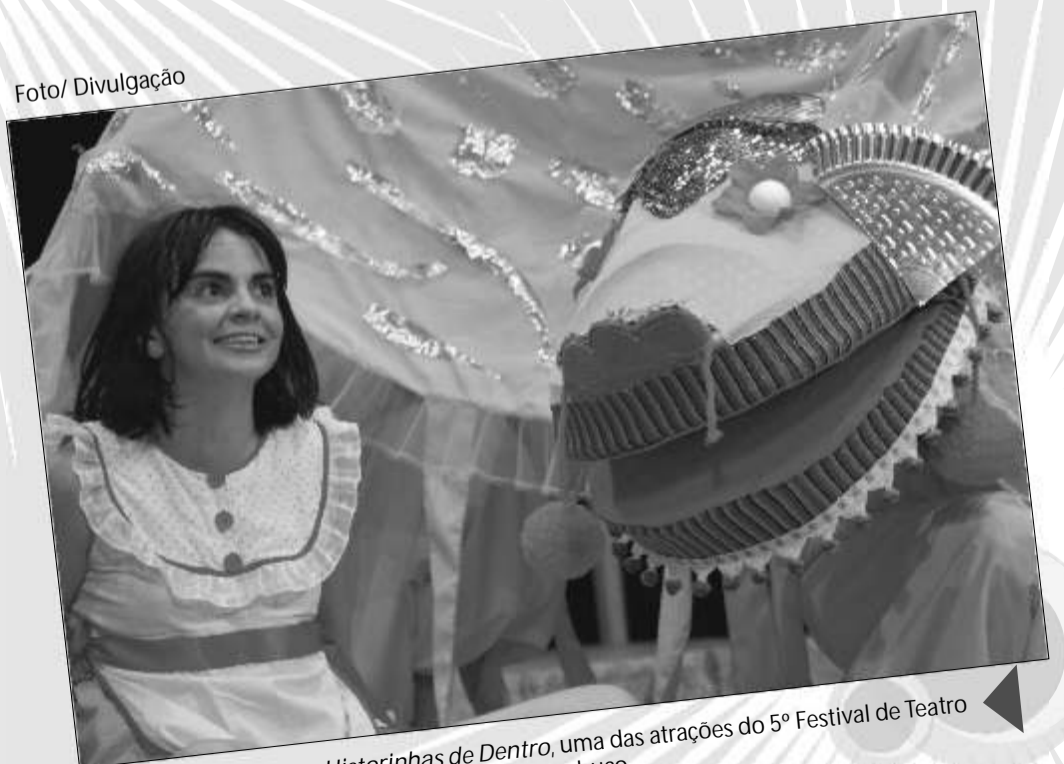
Historinhas de Dentro, uma das atrações do 5º Festival de Teatro para Crianças de Pernambuco