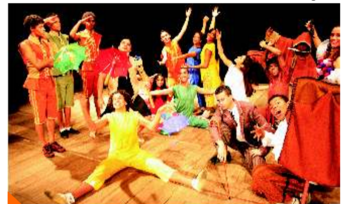
Elenco do Averso do Passo durante os ensaios