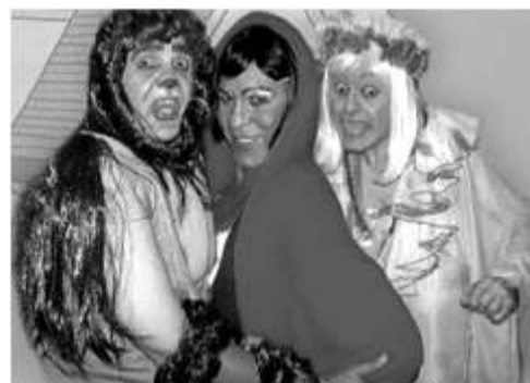
A Trupe do Barulho tem novo espetáculo na praça

Você já imaginou o lobo mau apaixonado pela Chapeuzinho Vermelho, uma garota de 18 anos, universitária, educada por uma mãe bem protetora e uma avó bem debochada? São com essas pitadas de humor e irreverência que a Trupe do Barulho estreia Chapeuzinho Vermelho, essa história sua vô não contou! , o mais novo espetáculo da companhia de comédia mais conhecida do Recife, que cumpre temporada no