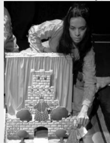
No Meio da Noite Escura tem Um Pé de Maravilha