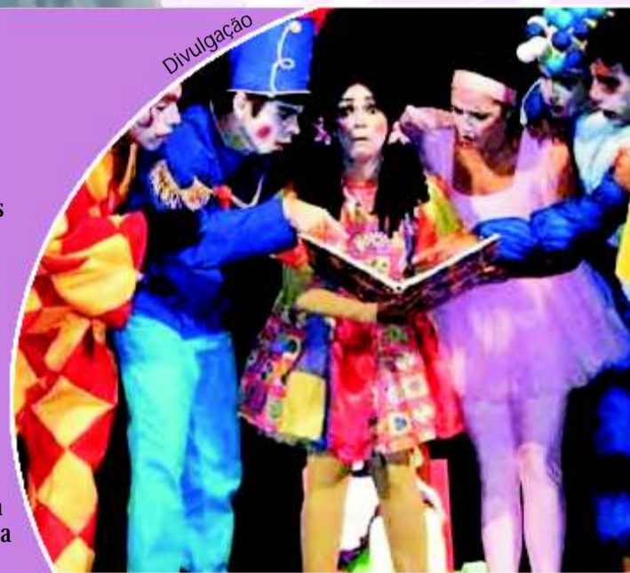
Clássico da dramaturgia infantil, A Revolta dos Brinquedos é encenado com elenco jovem