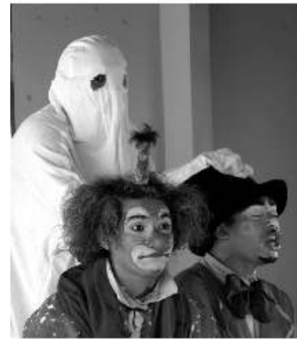
Palhaçadas – História de um Circo sem Lona está em cartaz no Espaço Inácia Raposo Meira

A encenação é realizada no Espaço Cultural Inácia Raposo Meira (Rua da Glória, 465, Boa Vista. Tel. 3421 3503), até 14 de novembro de 2010, somente aos domingos, às 15 e 17h. Ingresso: R$ 5 (preço único promocional). Com incentivo do Funcultura, o espetáculo vai poder destinar ingressos gratuitamente a ONGs, escolas públicas e comunidades que não têm acesso a espetáculos teatrais. É preciso um agendamento prévio pelo telefone 9267 5871 (a viabilização do transporte fica por conta deste projeto da Cia. 2 Em Cena).