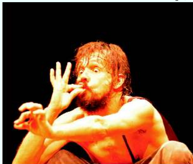
O protagonista da Descoberta , acochado por uma cruel economia da fome, quer sobreviver justamente para narrar sua história.