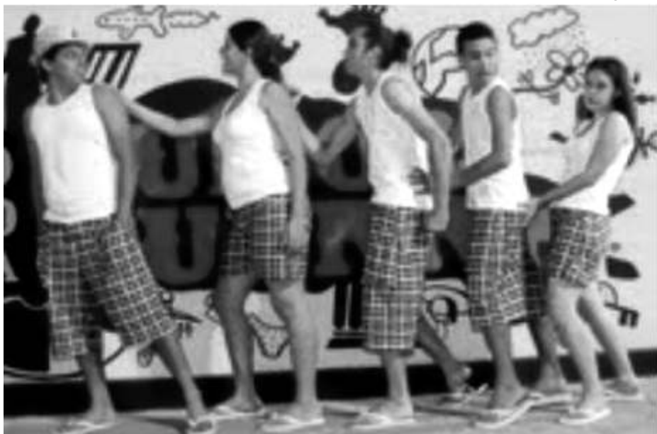
II Festival de Teatro de Igarassu: No Humor como na Guerra

O II Festival de Teatro de Igarassu (FESTIG), de caráter não competitivo e nacional, acontece de 03 a 12 de setembro, promovido pelo Grupo Teatral Ariano Suassuna – que comemora 10 anos de atividades em 2010 – adaptando um espaço cultural como palco principal, o Centro de Artes e Cultura Poeta Manoel Bandeira (Av. Joaquim Nabuco, s/n, Centro), com capacidade para até 300 espectadores. O evento conta com incentivo do Funcultura, e terá entrada sempre franca. A programação reúne mais de vinte peças diferentes, do Recife, Olinda, Igarassu, Jaboatão dos Guararapes, Vitória de Santo Antão, Limoeiro, João Pessoa (PB), São Luís (MA), Santa Luzia (SC) e Porto Alegre (RS).