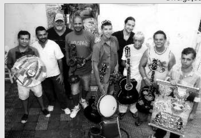
Artistas de várias tendências estéticas participam do Catamisto

O Projeto Festival Movimento Catamisto é uma idéia patrocinada pela Fundarpe – Governo de Pernambuco – aprovado através do Funcultura, na área de Artes Integradas. A programação sugere a reunião de várias vertentes artísticas, em forma de oficinas, exposições, show e mostras.