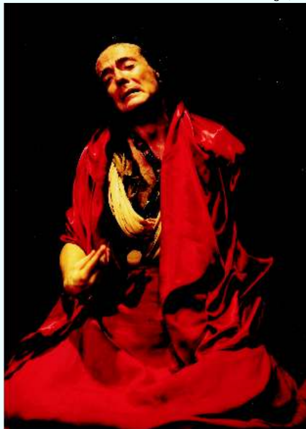
Kelbilim é baseado na vida de Santo Agostinho, que teve uma juventude mundana e egoísta

A Mostra Nacional do 22º Festival de Teatro do Agreste – FETEAG, de 20 a 30 de Outubro, em Caruaru, será aberta no dia 21, às 20h, no Teatro Rui Limeira Rosal, do Sesc, com o espetáculo A Descoberta das Américas , inspirado em fatos reais que ocorreram na Flórida e foram contados pelo cronista Cabeça de Vaca. Trata-se de uma produção da Leões de Circo Pequeno Empreendimentos, do Rio de Janeiro. Um ator sem aparato (cenário, figurino, iluminação e até texto são reduzidos ao mínimo), atua num estado essencial, de emergência. O desafio é de achar o jeito, a cada noite, de jogar com aquela platéia e fazer aquela platéia jogar.