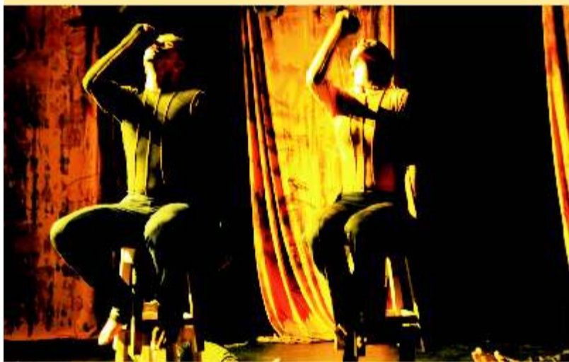
Entre os espetáculos do Janeiro que será exibido em Caruaru está Catrevage