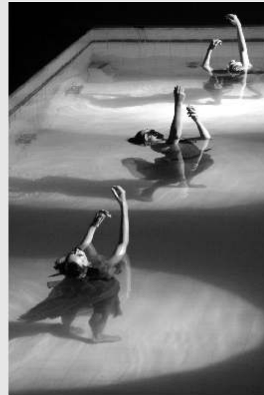
A liberdade do corpo n'água é tema do espetáculo Palavra Úmida , da Cia. dos Homens,

Partindo do reflexo narcísico, referências à sujeira do mundo também serão abordadas: drogas, pobreza, poluição ambiental. O tema serve de alerta para repensarmos o valor dado à água, elemento essencial da vida, mas cada vez mais escasso no planeta. As coreografias foram desenvolvidas pelos próprios bailarinos, partindo de estudos teóricos até experimentações individuais para cada movimento, retrabalhados pela diretora