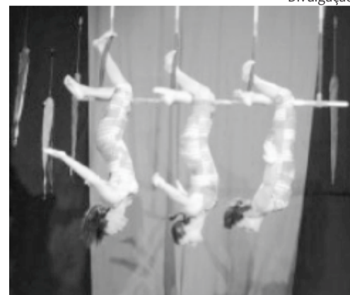
Escola Pernambucana de Circo inicia nova turma do Curso de Iniciação às Artes Circenses