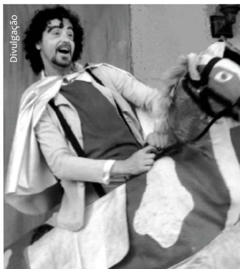
Garanhuns está presente no Festival de Teatro de Curitiba, com Aruá, o Boi Encantado