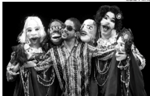
Cafuringa e as cafurinetes