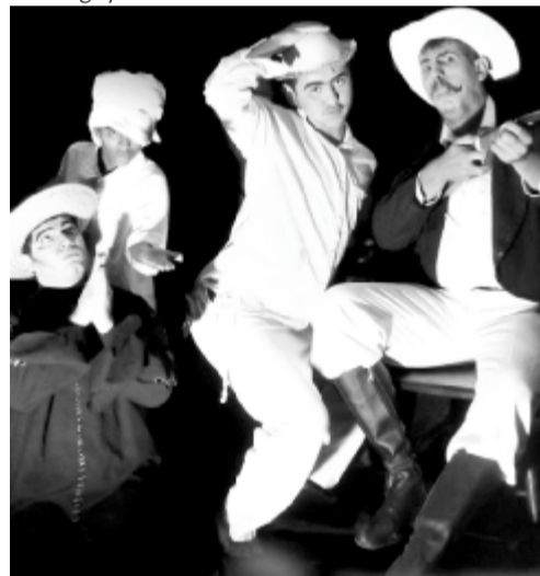
Cena da comédia O Rico Aventureiro , do Vid' Arte, que cumprirá temporada no Rio

A comédia O Rico Aventureiro , inspirada no escritor Ariano Suassuna e baseada na obra do francês Molière, encenada pelo Vid'Arte e Máquina Teatral, de Vitória de Santo Antão - PE, sob a direção de Leonardo Edardna, fará longa temporada no Teatro Miguel Falabella (Sala Atores de Laura), no Rio de Janeiro, de sexta a domingo, às 20h30, em abril.