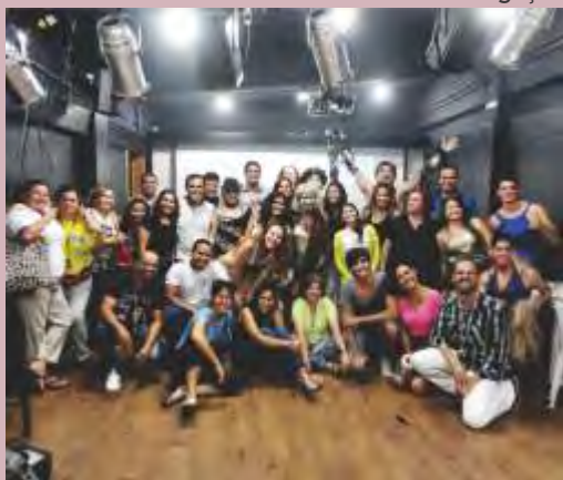
Concluintes do Curso de Teatro do Sesc Piedade